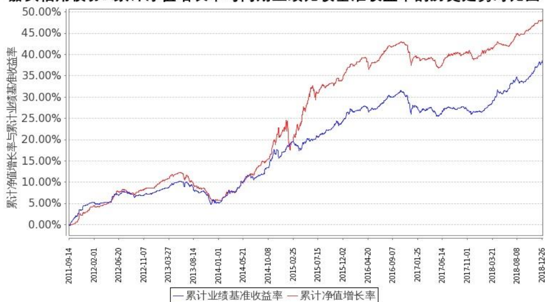
图 1: 嘉实信用债券 A 基金份额累计净值增长率与同期业绩比较基准收益率的历史走势对比