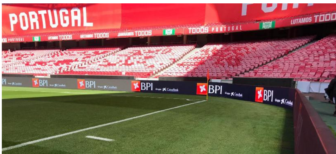
2020年欧洲杯预选赛项目

在体育显示领域，通过在行业内多年的人才储备、技术积累和市场拓展，“洲明体育”品牌影响力享誉全球。目前公司已配有专业的体育研发团队、市场调研团队、解决方案团队及售后支持团队，并为客户提供精准匹配符合各应用场馆及客户需求的体育应用解决方案。报告期内，公司助力 2020 年欧洲杯预选赛，为其提供专业的体育显示应用产品及解决方案。