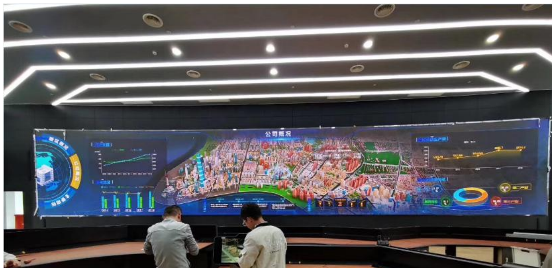
上海浦东电力指挥中心项目

清化、可视化的解决方案，目前公司可视化解决方案在智慧公安、智慧交通、智慧人防、智慧能源等多个应用场景成功运行。