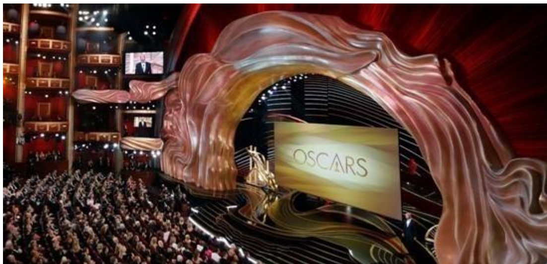
2019年奥斯卡颁奖典礼项目

在体育显示领域，通过在行业内多年的人才储备、技术积累和市场拓展，“洲明体育”品牌影响力享誉全球。目前公司已配有专业的体育研发团队、市场调研团队、解决方案团队及售后支持团队，并为客户提供精准匹配符合各应用场馆及客户需求的体育应用解决方案。报告期内，公司助力 2020 年欧洲杯预选赛，为其提供专业的体育显示应用产品及解决方案。