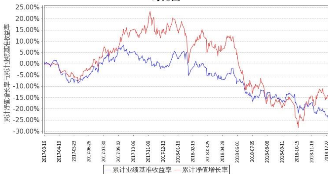
图 1：嘉实新能源新材料股票 A 基金累计份额净值增长率与同期业绩比较基准收益率的历史走势对比图