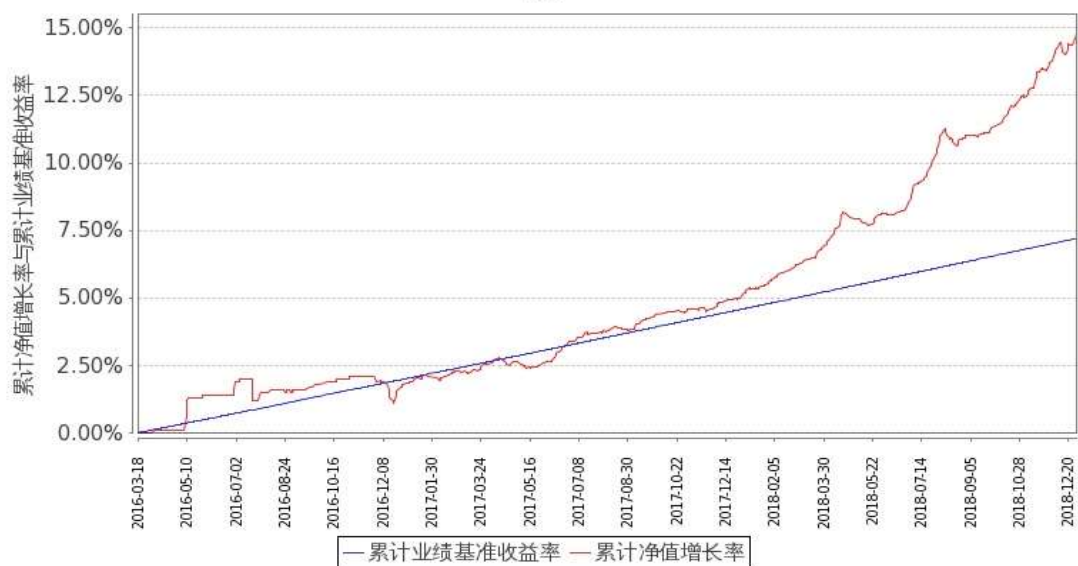
图 1：嘉实稳祥纯债债券 A 基金份额累计净值增长率与同期业绩比较基准收益率的历史走势对比图