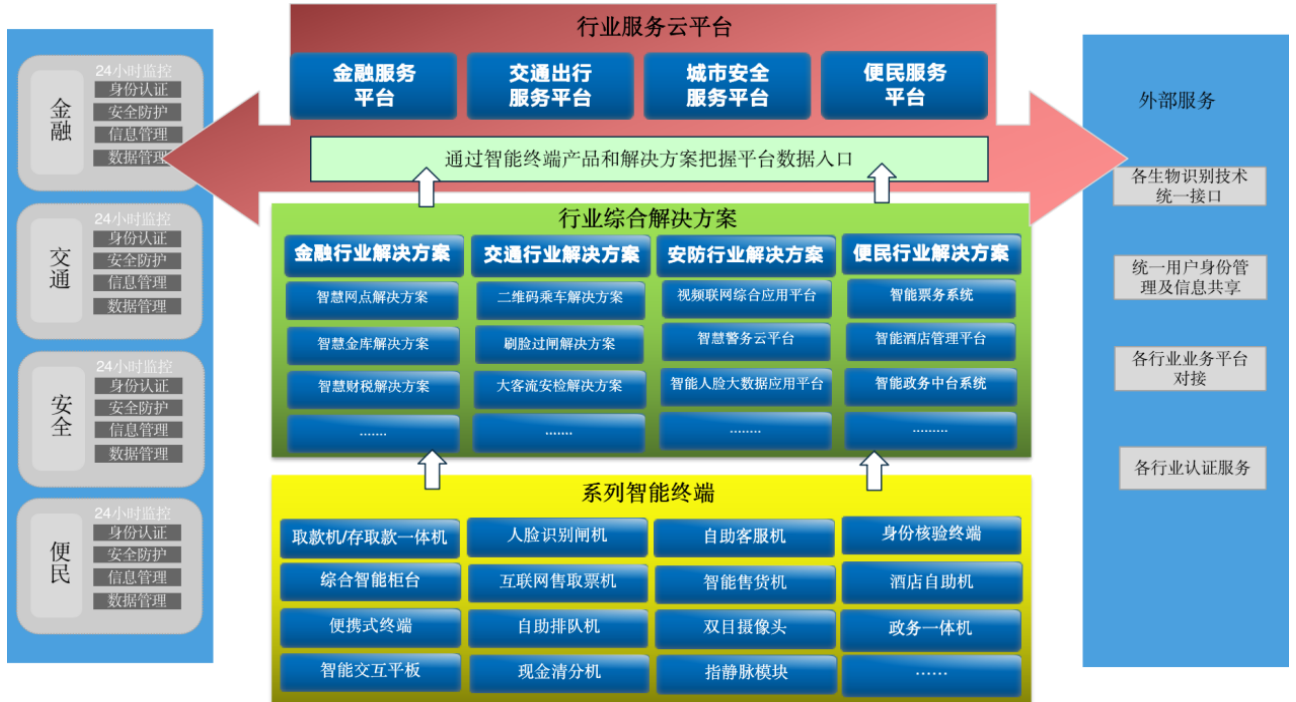
图1-广电运通业务发展逻辑图

1、业务发展战略： 以解决方案为切入口，紧贴用户需求，紧抓各行业应用场景，通过智能终端产品和解决方案把握数据入口，打造各行业大数据平台，为相关客户提供大数据应用服务。其中：