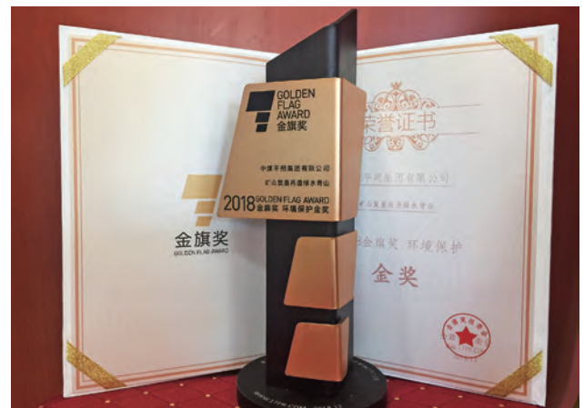
2018金旗奖环境保护金奖

加强社会责任沟通。 从2009年发布第一份社会责任报告起，中煤能源至今已连续十年发布社会责任报告，两次获得“央视财经50指数·十佳社会责任公司”荣誉。2018年，中煤能源荣获“中国上市公司社会责任建设100强”荣誉，中煤平朔集团“矿山复垦再造绿水青山”社会责任案例荣获“2018金旗奖环境保护金奖”，被评为“2018年度环保社会责任企业”。