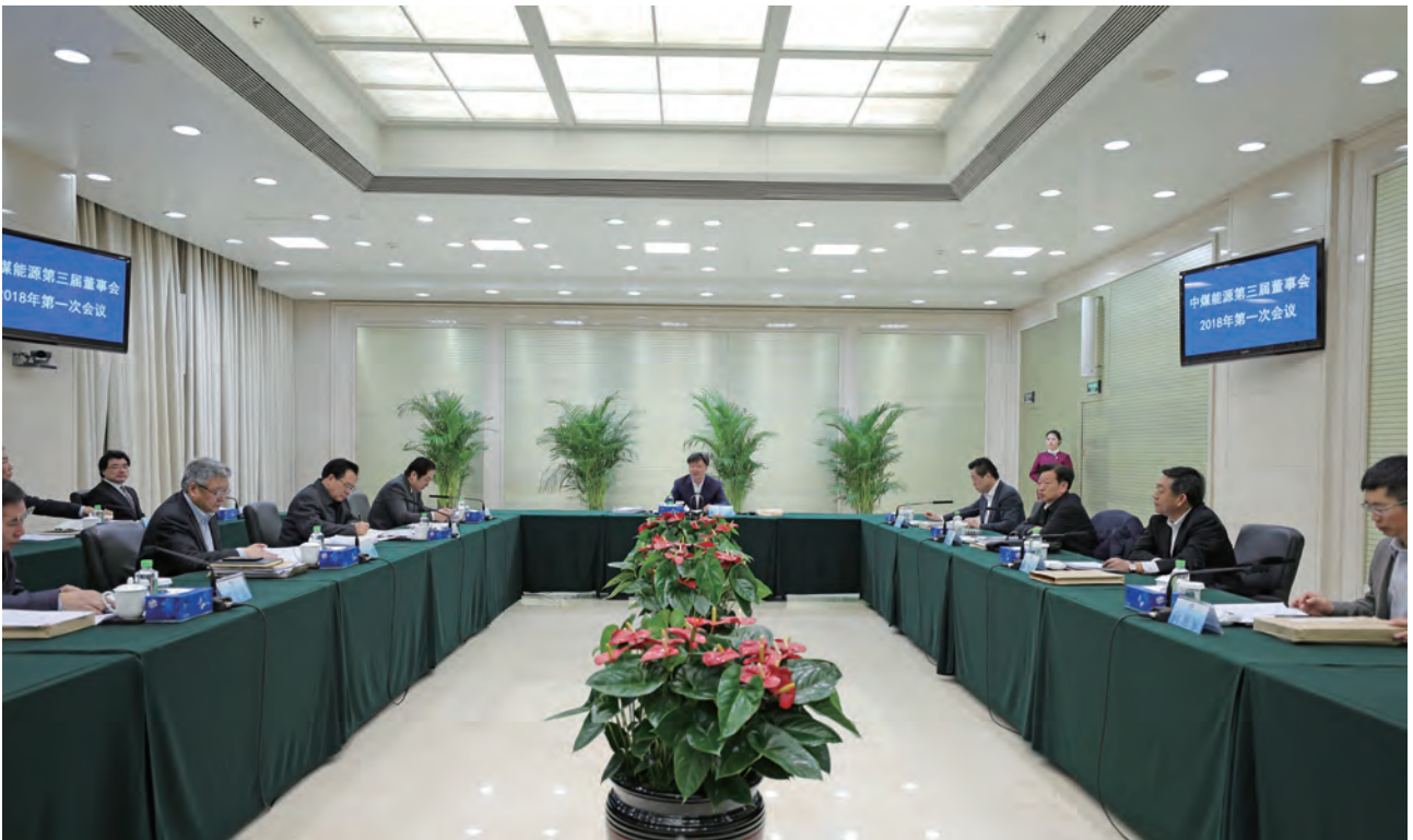
中煤能源董事会会议

薪酬与绩效考核工作。监事会对股东大会负责，依据《公司章程》及相关法律法规，监督日常经营活动及董事、高管履职情况。董事会下设审计与风险、薪酬、战略、安全健康环保、提名五个专门委员会；注重发挥董事会各专门委员会作用，重大决策事项在提交董事会审议前先由专门委员会讨论。公司董事会独立董事比例三分之一，符合监管机构要求；建立独立董事实地考察调研的工作机制，统筹安排董事会年度会议计划，创新会议组织形式，保证独立董事按时参会并充分发表意见。2018年，中煤能源组织召开股东大会2次、董事会全体会议5次、监事会会议4次。中煤能源董事会加强对公司发展战略、投资计划、财务管理、生产经营等重大事项的科学决策和监督，指导推动企业改革发展，有效提升了公司核心竞争力和可持续发展能力。