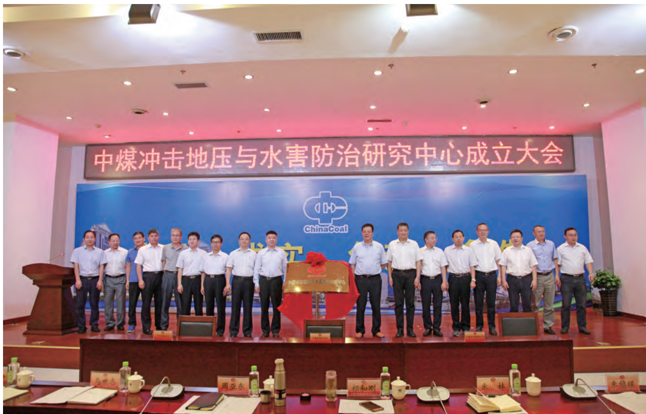
中煤冲击地压和水害防治研究中心

2018年，公司取得一批高水平重要科技成果，核心技术竞争力进一步增强。本年度获得行业科技进步奖21项，授权专利155项，核心技术支撑产业发展的能力不断提升。