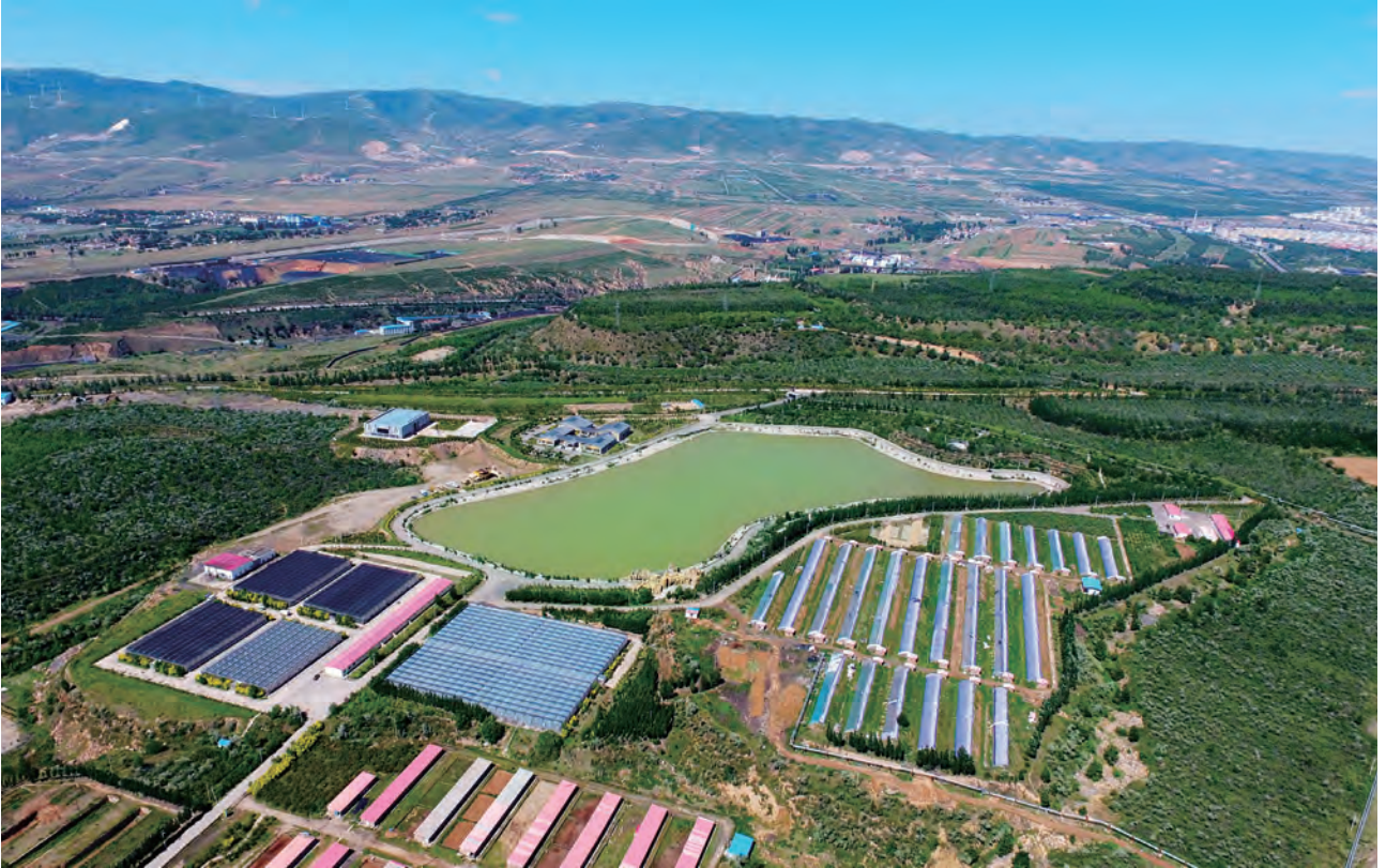
中煤平朔生态复垦区