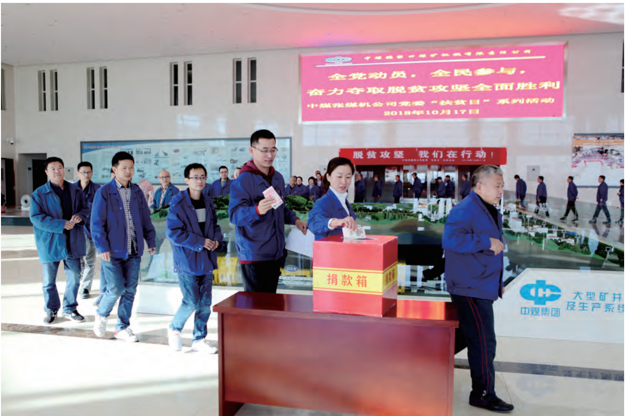
“国家扶贫日”捐款活动