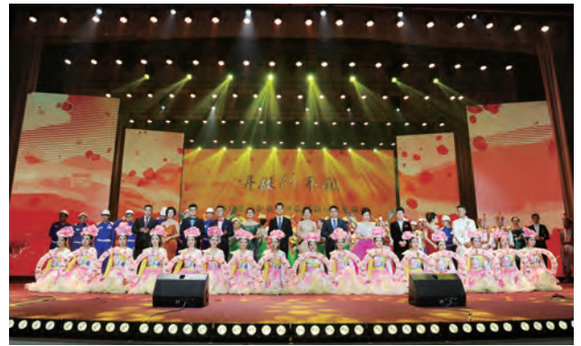
平朔矿区庆祝改革开放40周年文艺晚会