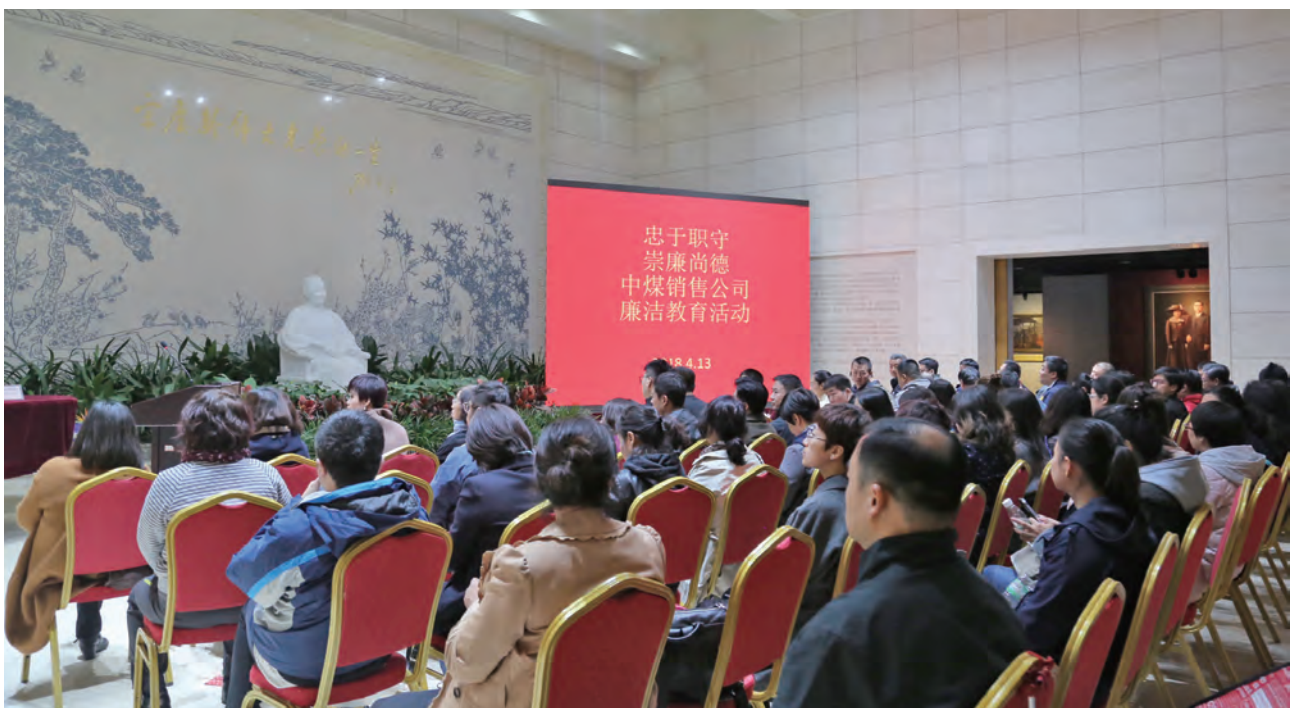
中煤销售公司开展廉洁教育活动

透明运营。 公司制定了信息公开工作方案，明确了信息公开的原则、内容、程序和工作计划。针对员工和社会关注的招聘、采购、招标、干部任用等热点问题，公司坚持计划公开、过程公开、结果公开，接受社会监督，杜绝暗箱操作。坚持厂务公开制度，通过职代会、公告栏、意见箱等方式，定期公开企业重大事项、领导干部职务消费情况、资产财务情况，鼓励员工建言献策、参与企业管理。公司每年通过企业网站、报纸、社会责任报告、企业年报等媒介和载体，及时公布公司经营发展情况，主动回应社会关切。公司建立新闻发言人制度，及时答复媒体及投资者问题，建立了良好的沟通机制。