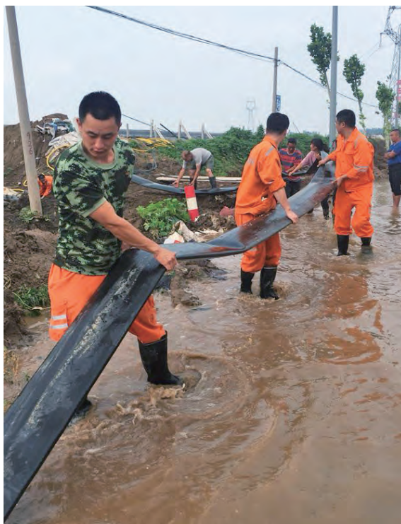
上海能源公司抗洪救援队

立方米、连接排水管路1,640米、铺设电缆616米、抢救大棚12个……圆满完成了救援任务。