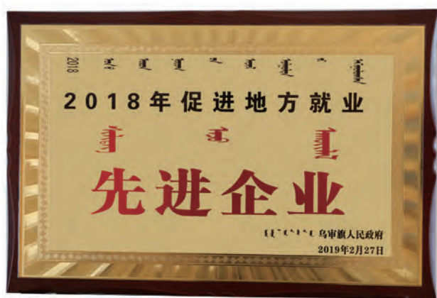
“促进地方就业先进企业”奖牌