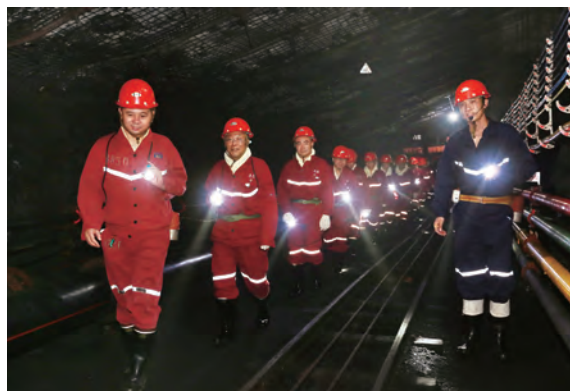
安全生产标准化建设

高要求提升标准。上海能源公司大力加强基础、基层、基本功“三基建设”，全面贯彻技术、管理、岗位工作“三大标准”，以新标准为引领，不断提升安全生产标准。坚持对各矿标准化工作每月一次动态检查，每季度一次静态检查，平时紧盯管理现场进行专项检查，不断提升安全生产标准化水平。