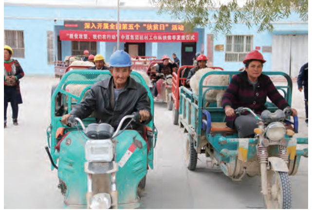
新疆分公司发放“扶贫羊”

加强基础设施建设。帮助贫困村进行道路硬化、安装路灯等，不断改善贫困群众生产生活条件。