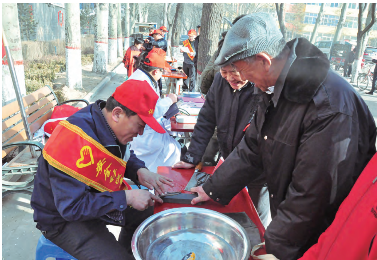
开展志愿者服务活动

中煤能源热心社会公益，支持并鼓励员工参与形式多样的志愿者服务活动，经常性地开展“传真情、送温暖、献爱心、一帮一、结对子”等义务活动，通过力所能及的行动，为当地的困难户，特别是为老年人以及其它需要帮助的人群送去关爱和温暖，向社会传递正能量。