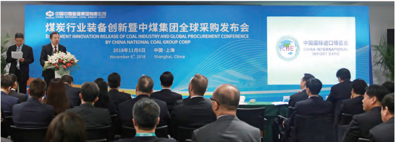
中煤能源全球采购发布会

依法治企。 公司秉承依法治企、合规经营理念，全面打造依法治企的企业法人、诚实守信的经营实体、公平竞争的市场主体，模范遵守国家法律法规和政府监管规定，积极维护企业信用。公司制定了《中煤能源依法治企工作方案》，提出了建立法律风险管理标准、加强公司合规管理工作、深入推动法律管理体系、全面提升依法治企能力等四个方面的具体工作措施。加强总法律顾问制度建设，公司所属重要子企业全部建立了总法律顾问制度，为企业合规经营提供了有力支撑。