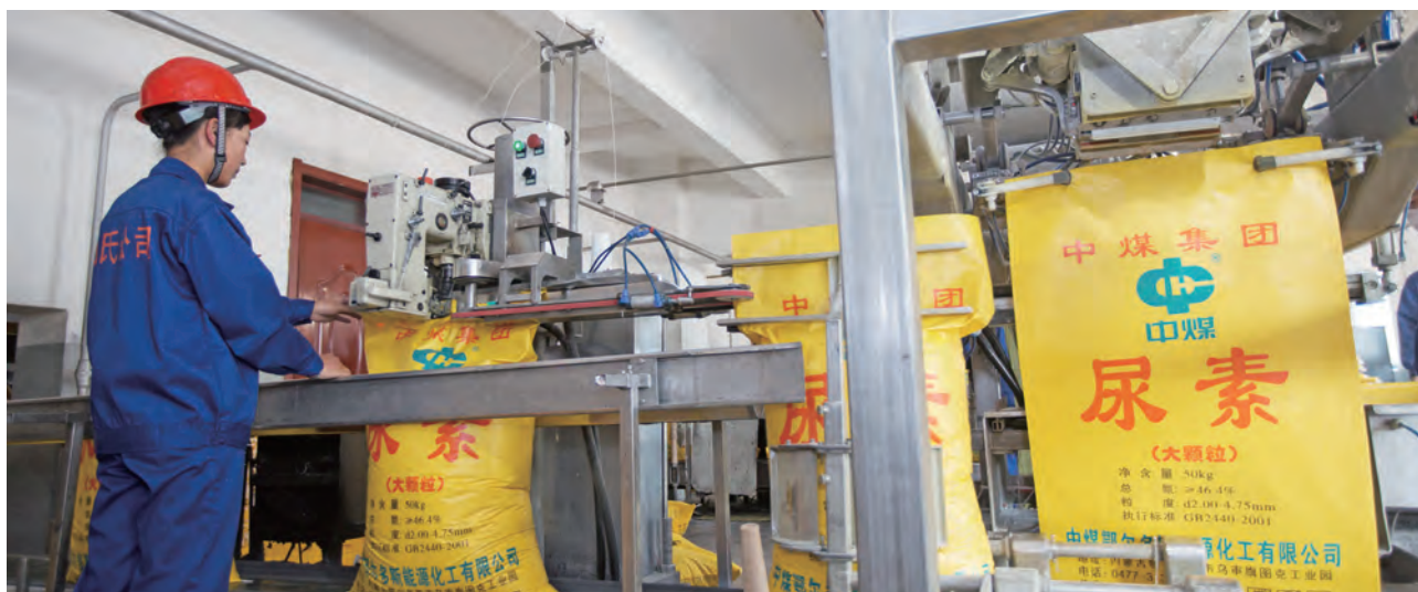
中煤大颗粒尿素产品

装备公司严抓产品质量管理，加强生产过程控制，严格兑现质量奖惩，不断提高全面质量管理水平。2018年，装备公司主要生产企业相继通过了国际焊接质量管理体系、QEO三体系审核和CNAS实验室监督评审、EN1090钢结构产品认证年度监督审核，企业质量管理规范运行能力、生产制造质量保障能力持续加强。装备公司2018年质量损失同比降低18.4%。各级管理和技术服务人员深入用户现场，了解产品运行情况，打好售后服务和产品质量改进“主动仗”。积极开展用户满意度调查，做好用户主机产品摸底、登记，就设备型号、工况、用户反馈、整改方案、负责人、回访记录等进行统计梳理，建立内部用户售后服务统计台账，定期跟踪用户反馈，督促改进工作，进一步提升了服务水平。