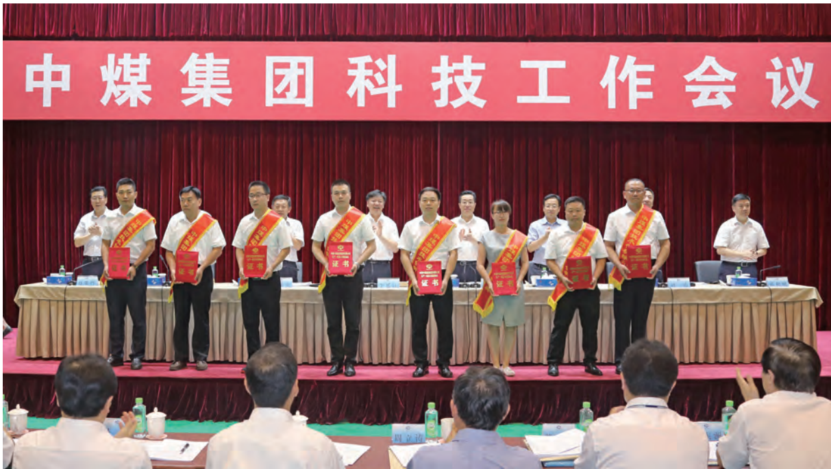
中煤能源科技工作会议