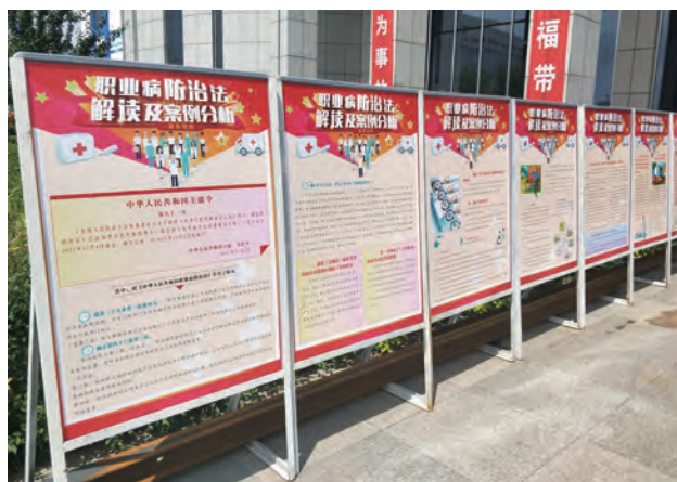
职业健康宣传教育培训

加强体检监护，保障职业健康。严格按照规定对接触职业危害的员工进行职业健康体检，远离职业危害。坚持职业健康“三同时”建设，做到煤矿、电力及煤化工建设项目职业危害防护设施与主体工程同时设计、同时施工、同时投入生产和使用，切实保护劳动者的职业健康。