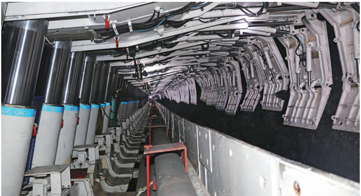
智能化开采工作面

打造智能化品牌。装备公司在国内最早实施了薄煤层采煤机、刨煤机智能化开采研发项目，主导和参与了黄陵、张集等十余个智能化工作面的三机配套，培育了国内实力最强的智能化开采成套技术研发及产业化力量。装备公司正在集中尖端技术力量，全力推进实施“中天合创智能化开采工作面项目”“华晋焦煤智能化放顶煤项目”，力争通过自动化、信息化、网络化等前沿智能技术的集成创新与产业应用，进一步创新完善综采综放工作面智能化系统解决方案，打响“中煤智能化”品牌，更好地为用户创造价值，引领行业创新发展。