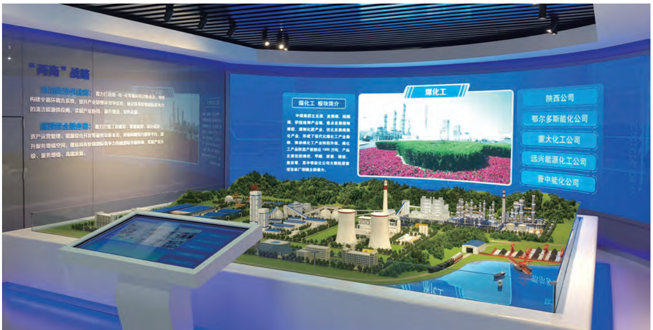
中煤能源产业沙盘

公司所属中国煤矿机械装备有限责任公司是国内规模最大、产品成套服务最全的煤矿装备制造企业，在国内率先形成煤矿综采综掘装备成套研发、制造和供应能力，建成国际领先水平的煤机装备试验平台，为煤矿装备水平提升、煤矿装备国产化和煤炭行业技术进步起到积极的推动示范作用。