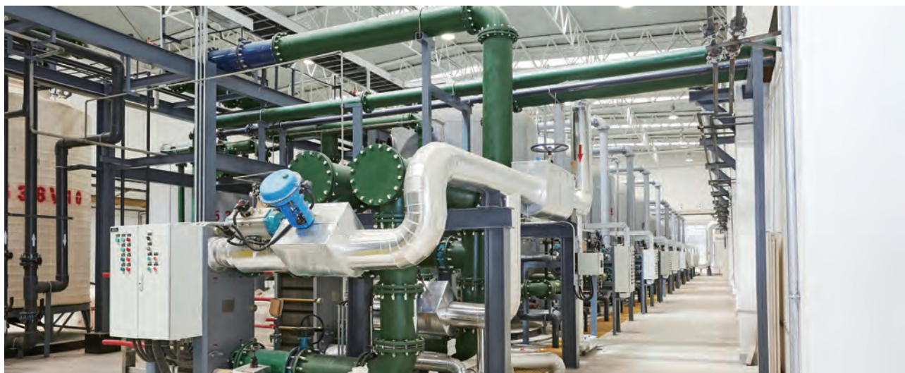
矿井水深度处理工程

公司废水排放主要是煤矿、煤化工企业，主要污染物为化学需氧量和氨氮，执行的排放标准为《煤炭工业污染物排放标准》(GB20426-2006)、《污水综合排放标准》(GB8978-1996) 和《地表水环境质量标准》(GB3838-2002) III类标准等。公司根据矿井水、工业废水、生活污水等不同水质特点和回用途径采取相应的处理工艺，在满足排放标准的基础上，不断提高废水资源化利用水平。公司在鄂尔多斯地区的煤炭、化工企业对矿井水进行深度处理利用，为矿井水“无害化、资源化、全复用”奠定了基础，实现了矿