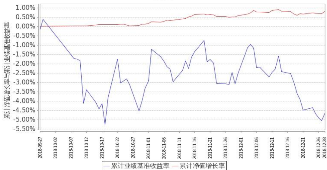
图 1：嘉实新添康定期混合 A 基金累计份额净值增长率与同期业绩比较基准收益率的历史走势对比图