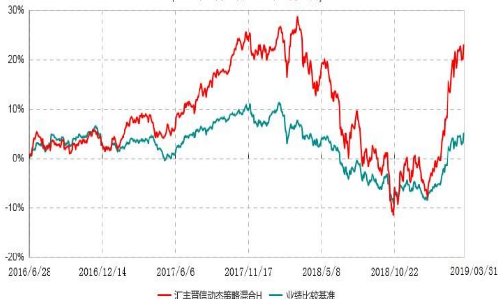
汇丰晋信动态策略混合H累计净值增长率与业绩比较基准收益率历史走势对比图 (2016年06月28日-2019年03月31日)