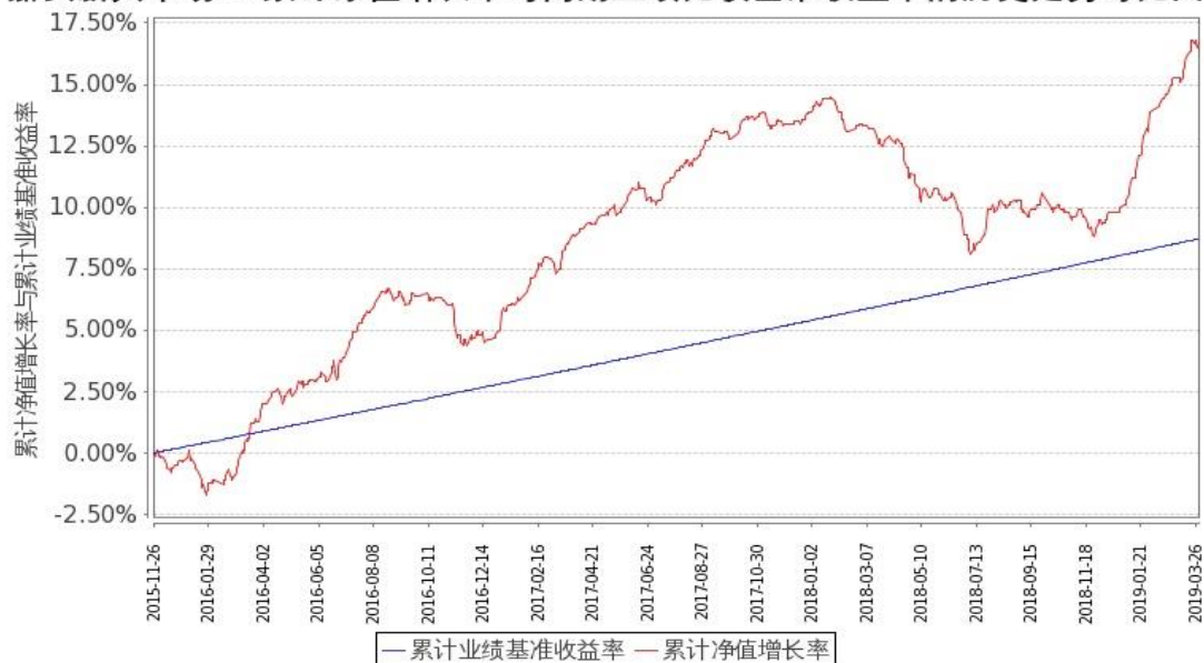
图 2：嘉实新兴市场 C2 份额累计净值增长率与同期业绩比较基准收益率的历史走势对比图（2015 年 11 月 26 日至 2019 年 3 月 31 日）

注：按基金合同和招募说明书的约定，本基金自基金合同生效日起 6 个月内为建仓期，建