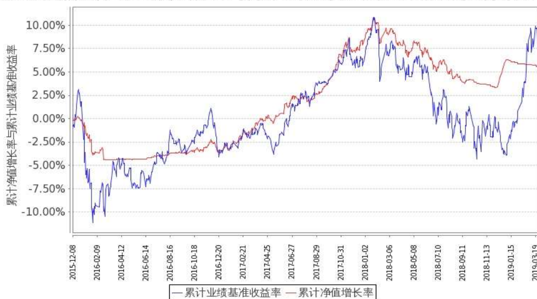
图2：嘉实新起点混合C基金份额累计净值增长率与同期业绩比较基准收益率的历史走势对比图