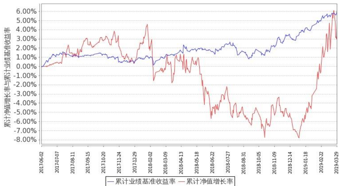
图2：嘉实稳宏债券C基金份额累计净值增长率与同期业绩比较基准收益率的历史走势对比图