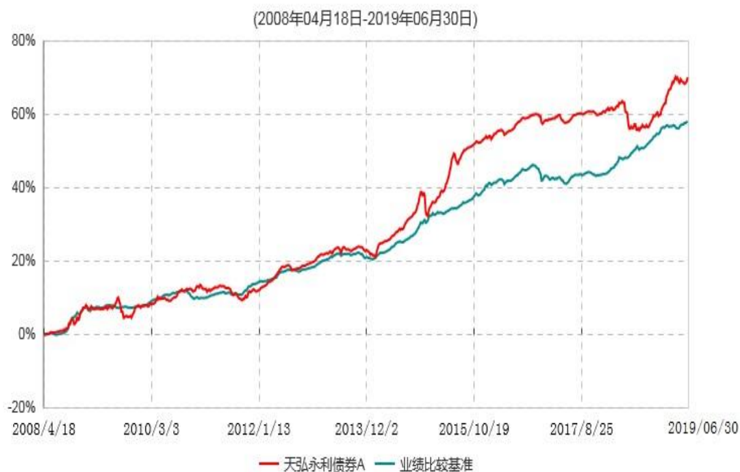
天弘永利债券A累计净值增长率与业绩比较基准收益率历史走势对比图