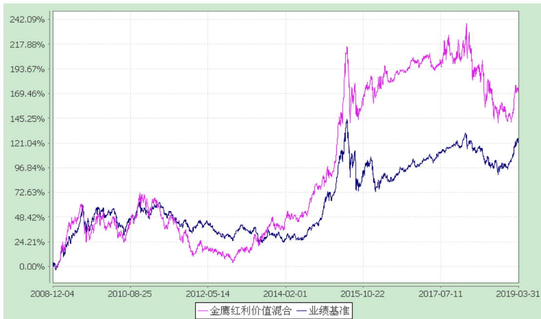
金鹰红利价值灵活配置混合型证券投资基金 累计净值增长率与业绩比较基准收益率历史走势对比图 (2008 年 12 月 4 日至 2019 年 3 月 31 日)