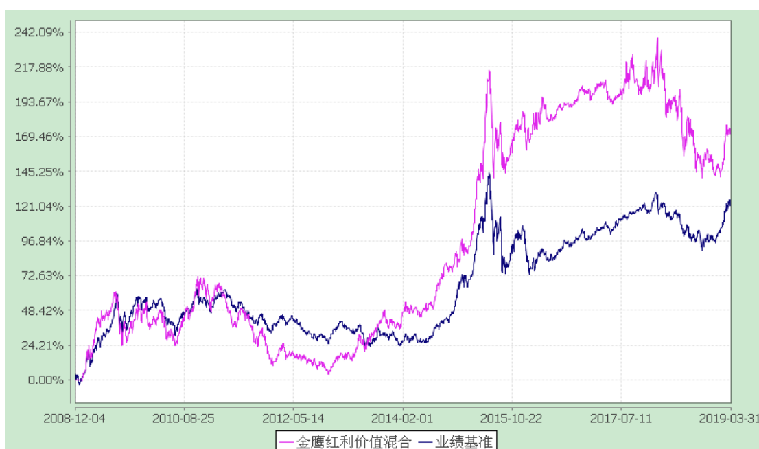
金鹰红利价值灵活配置混合型证券投资基金 累计净值增长率与业绩比较基准收益率历史走势对比图 (2008 年 12 月 4 日至 2019 年 3 月 31 日)