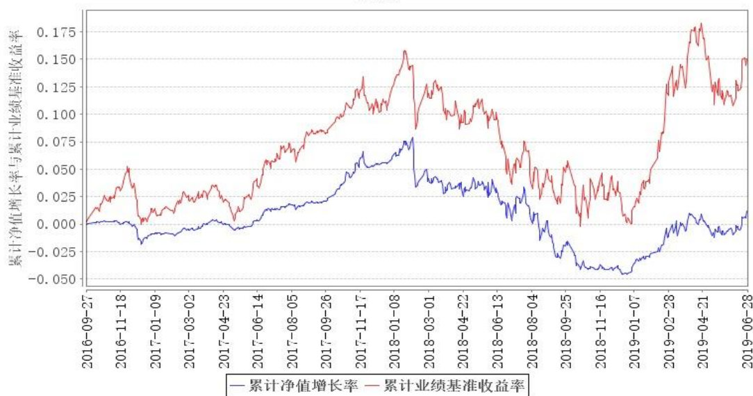
鹏华兴合定期开放混合A类累计净值增长率与同期业绩比较基准收益率的历史走势对比图