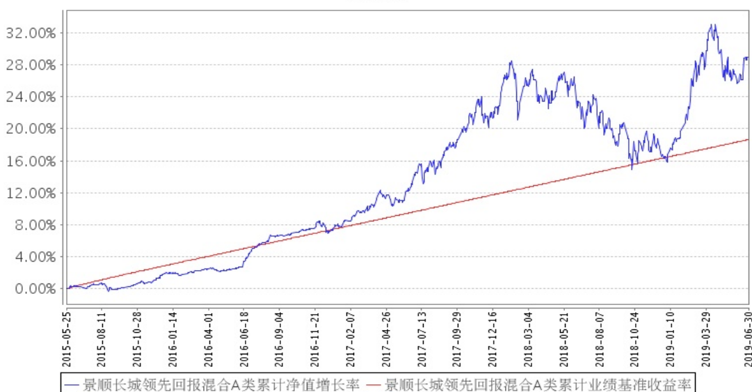
景顺长城领先回报混合A类累计净值增长率与同期业绩比较基准收益率的历史走势对比图