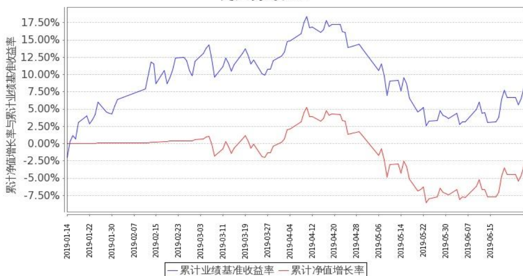
图1：嘉实港股通新经济指数(LOF)A基金份额累计净值增长率与同期业绩比较基准收益率的历史走势对比图