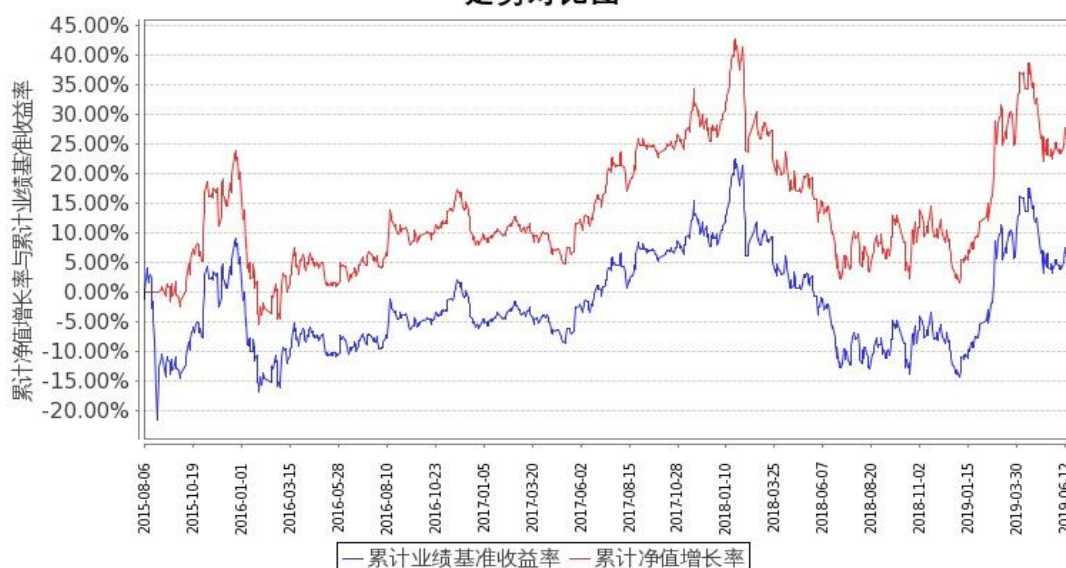
图 1：嘉实中证金融地产 ETF 联接 A 基金份额累计净值增长率与同期业绩比较基准收益率