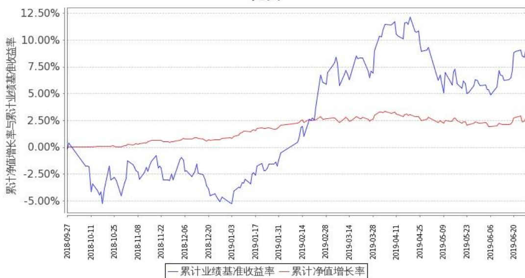
图 1：嘉实新添康定期混合 A 基金累计份额净值增长率与同期业绩比较基准收益率的历史走势对比图