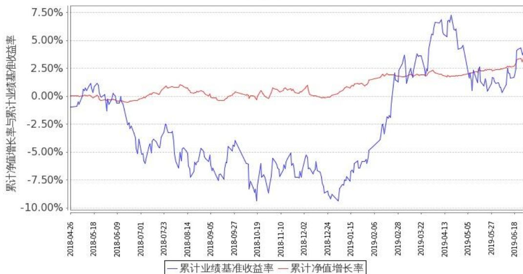
图 1：嘉实新添荣定期混合 A 基金份额累计净值增长率与同期业绩比较基准收益率的历史走势对比图