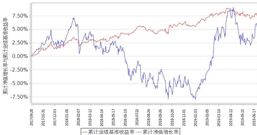
图 1：嘉实新添辉定期混合 A 基金累计份额净值增长率与同期业绩比较基准收益率的历史走势对比图