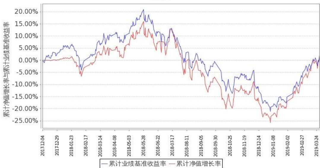
图 1：嘉实医药健康股票 A 基金累计份额净值增长率与同期业绩比较基准收益率的历史走势对比图