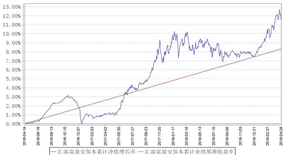
汇添富盈安保本累计净值增长率与同期业绩比较基准收益率的历史走势对比图

注：本基金建仓期为本《基金合同》生效之日（2016 年 4 月 19 日）起 6 个月，建仓期结束时各项资产配置比例符合合同规定。