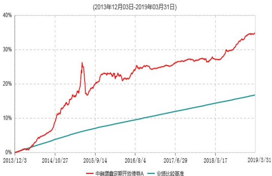
中融增鑫定期开放债券A累计净值增长率与业绩比较基准收益率历史走势对比图