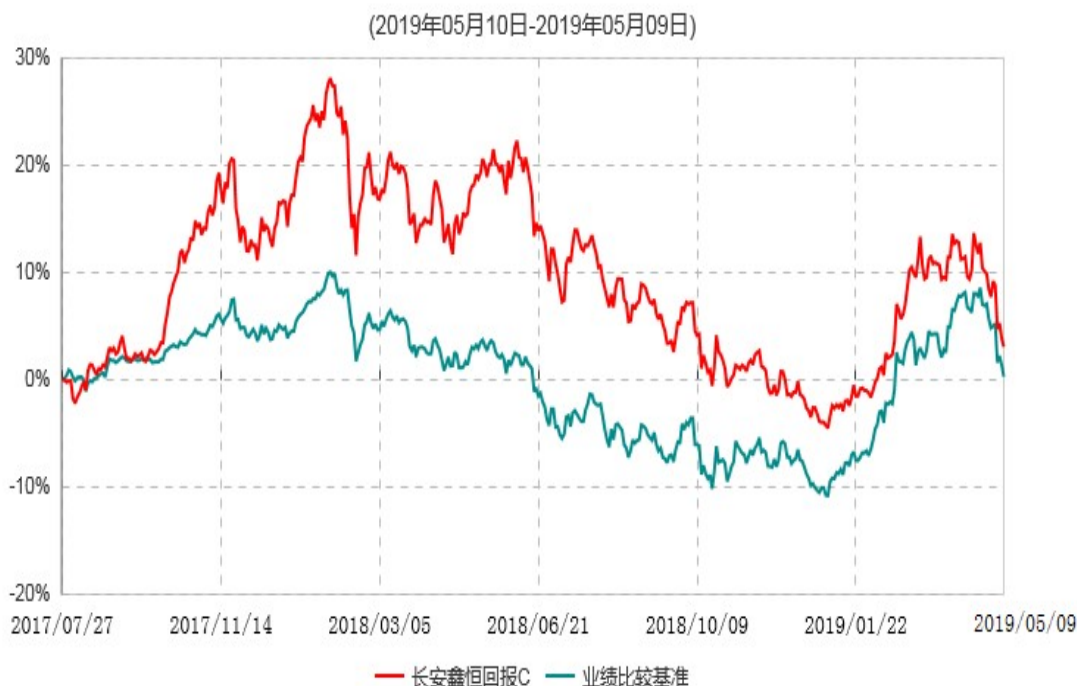
长安鑫恒回报C累计净值增长率与业绩比较基准收益率历史走势对比图

自基金合同生效之日起6个月内基金各项资产配置比例需符合基金合同要求。建仓期结束后，各项资产配置比例已符合基金合同有关投资比例的约定。本基金从2019年5月10日转型为长安泓源纯债债券型证券投资基金，上图报告期间的结束日为2019年5月9日。