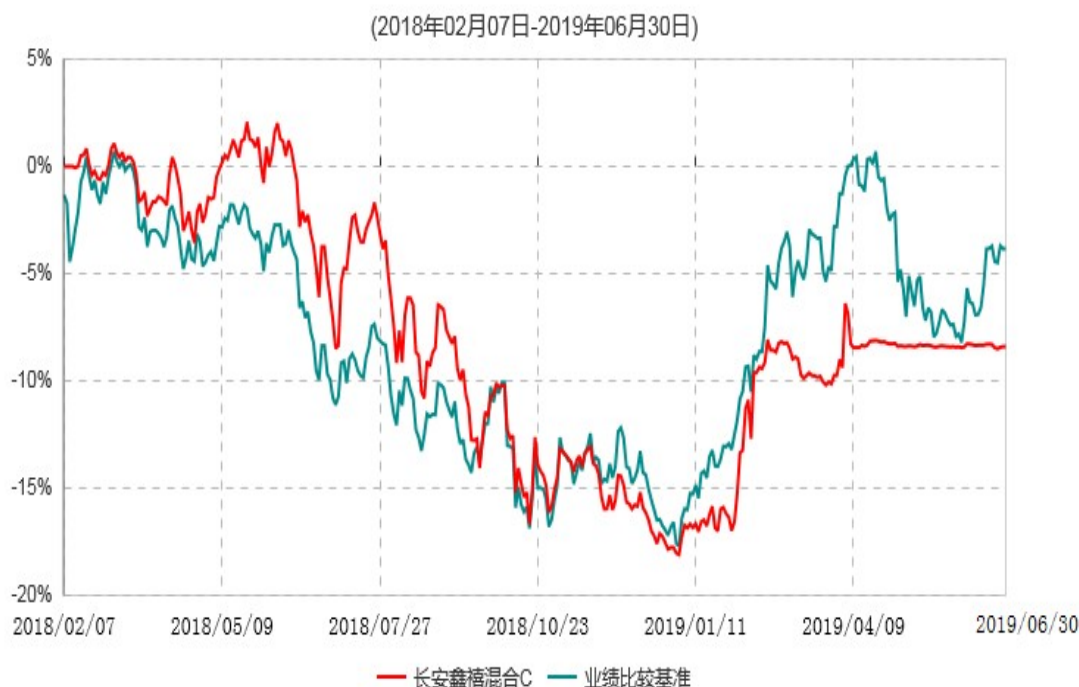
长安鑫禧混合C累计净值增长率与业绩比较基准收益率历史走势对比图

根据基金合同的规定,自基金合同生效之日起 6 个月内基金各项资产配置比例需符合基金合同要求。本基金在建仓期结束后,各项资产配置比例已符合基金合同有关投资比例的约定。图示日期为 2018 年 2 月 7 日至 2019 年 6 月 30 日。