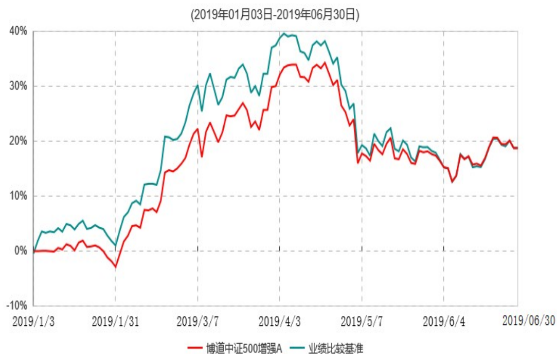
博道中证500增强A累计净值增长率与业绩比较基准收益率历史走势对比图

注：本基金基金合同生效日为 2019 年 1 月 3 日，基金合同生效日至报告期期末，本基金运作时间未满一年。本基金建仓期为自基金合同生效日起的 6 个月。截至 2019 年 6 月 30 日，本基金尚处于建仓期。