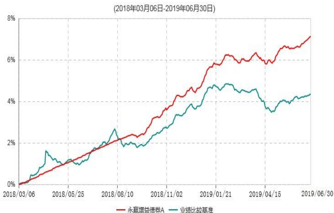
永赢增益债券A累计净值增长率与业绩比较基准收益率历史走势对比图

注：1、本基金建仓期为本基金合同生效日起 6 个月，建仓期结束当日，除债券投资比例未达到合同约定外，其他各项资产配置符合合同约定。债券投资比例未达到合同约定系交易对手原因导致现券买入交易结算失败所致，本基金于 2018 年 9 月 6 日及时买入债券将债券投资比例提高至合同约定的范围内。