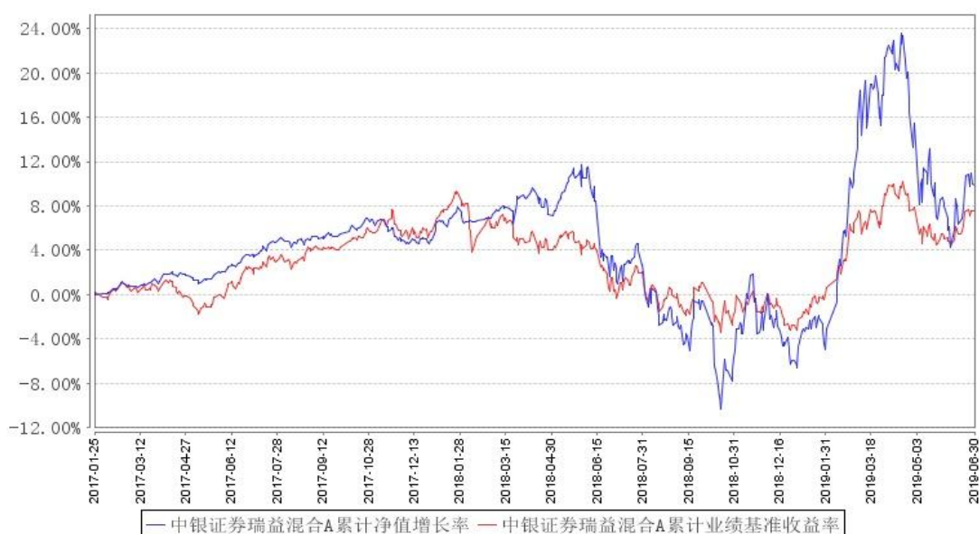
中银证券瑞益混合A累计净值增长率与同期业绩比较基准收益率的历史走势对比图