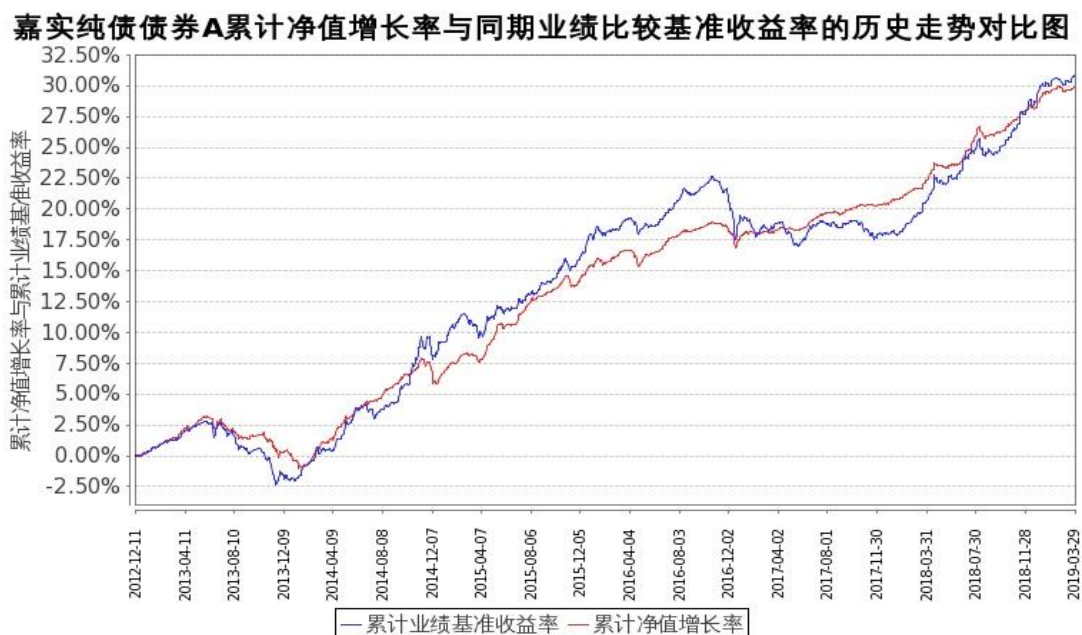
图 1：嘉实纯债债券 A 基金份额累计净值增长率与同期业绩比较基准收益率的历史走势对比

（二）自基金合同生效以来基金累计净值增长率变动及其与同期业绩比较基准收益率变动的比较