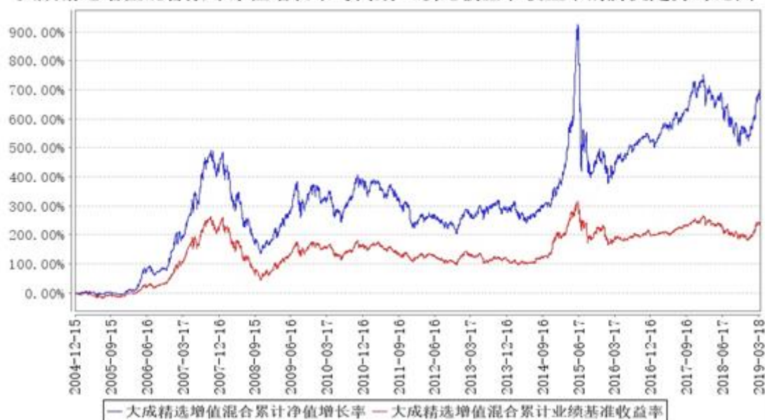
大成精选增值混合累计净值增长率与同期业绩比较基准收益率的历史走势对比图

注：1、本基金合同规定，基金管理人应当自基金合同生效之日起六个月内使基金的投资组合比例符合基金合同的约定。建仓期结束时，本基金的投资组合比例符合基金合同的约定。