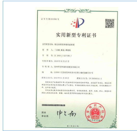
硫化钠蒸发浓缩结晶装置-实用新型