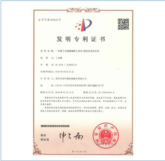
一种基于分壁精馏塔分离苯-烯烃体系的系统-发明专利