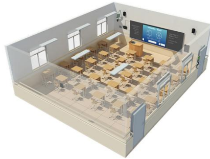
智慧教室解决方案

公司产品主要面向国内K12体系内的中小学校销售，2019年开始公司进一步向高校、幼教、培训机构等非K12教育市场拓展。截止2019年6月末，“鸿合HiteVision”智能交互产品累计装机约230万台/套，成为教育信息化领域的知名品牌。与此同时，教育信息化浪潮席卷全球。公司依托Newline的品牌知名度及定制化的产业能力等多重因素，推动境外教育行业的出货量持续上升。