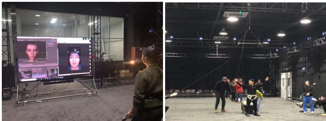
③ 已完成的游戏项目：腾讯游戏“秦时明月”制作。

《西域公主》、《老北京》、《神雕侠侣》等项目的后期特效制作。制作周期比预期缩短了 40%。