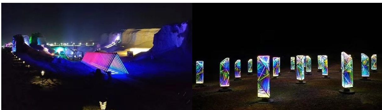
世界魔鬼城沉浸式互动灯光体验秀