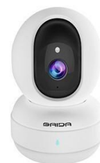
（上图依次为安徽赛达的云视频监控产品、云视频会议产品终端）