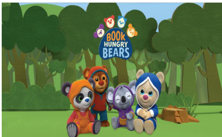
（上图为《小熊读书会》海报）

③恒信东方儿童和紫水鸟影像、Breakthrough Entertainment合拍的动画片《小熊读书会》，共52集，每集11分钟，动画片前期由紫水鸟影像、Breakthrough Entertainment制作，恒信东方儿童负责中、后期生产制作，目前正在制作中。