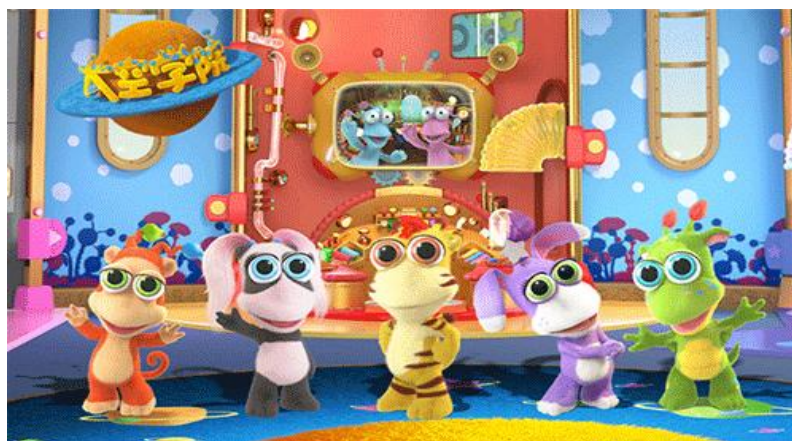
（上图为《太空学院》海报）

③恒信东方儿童和紫水鸟影像、Breakthrough Entertainment合拍的动画片《小熊读书会》，共52集，每集11分钟，动画片前期由紫水鸟影像、Breakthrough Entertainment制作，恒信东方儿童负责中、后期生产制作，目前正在制作中。