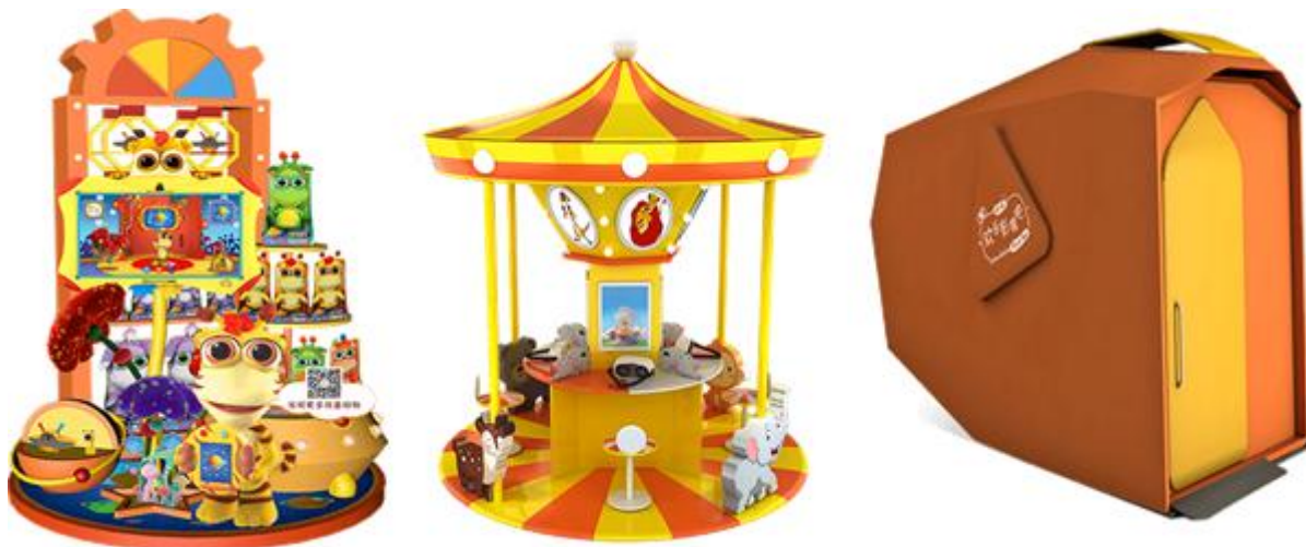
（上图从左到右依次为AI合家欢体验岛、VR欢乐岛和魔幻小屋）

魔幻小屋基于深度学习技术，通过智能抠像、智能照片挑选、智能照片精修、云计算、图像压缩等技术手段，智能结合知名设计师设计的背景模板，只需要3-5分钟即可现场输出艺术写真级别的照片。