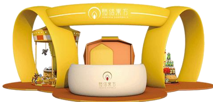
（上图为合家欢体验中心效果图）

公司基于AI合家欢平台开发出了恒信东方儿童智能电视机和恒信东方儿童宝盒（机顶盒），以及面向大型商业综合体包括AI合家欢体验岛、VR欢乐岛和魔幻小屋在内的体验中心系列产品。