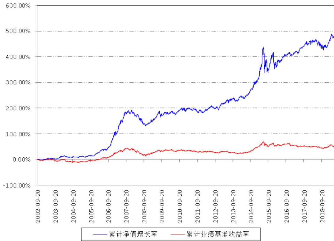
南方宝元A累计净值增长率与同期业绩比较基准收益率的历史走势对比图