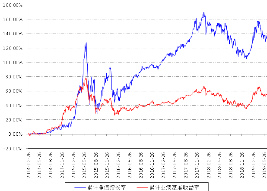
南方新优享A累计净值增长率与同期业绩比较基准收益率的历史走势对比图