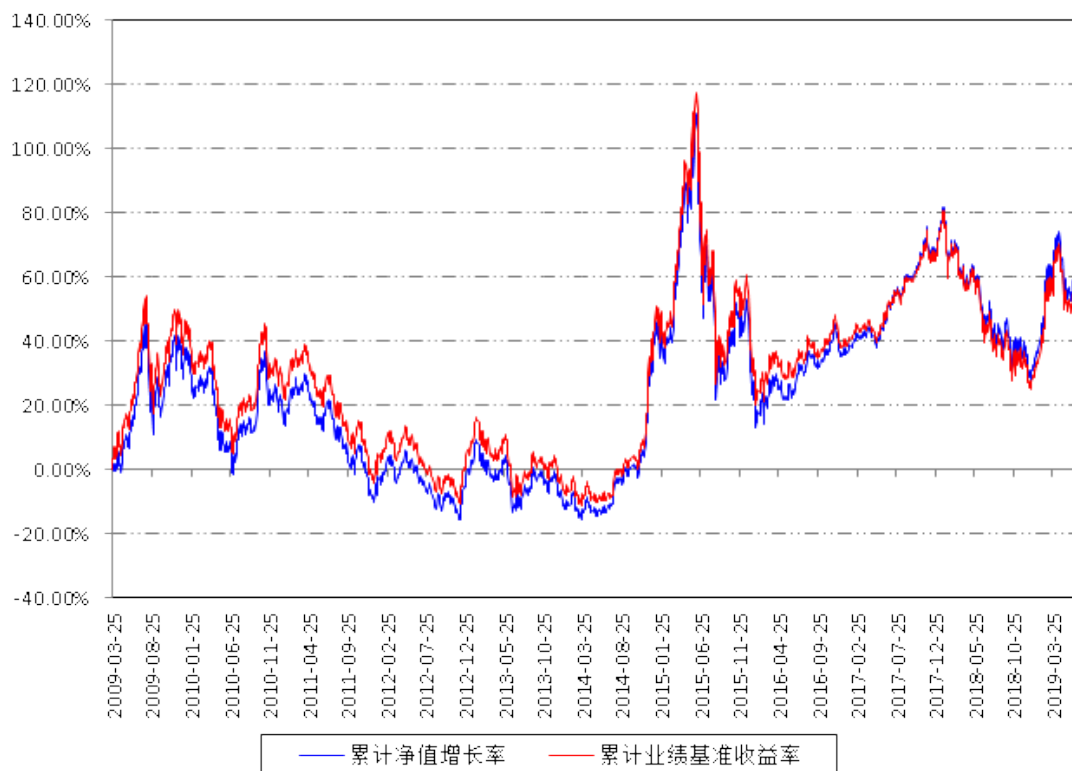
南方300联接A累计净值增长率与同期业绩比较基准收益率的历史走势对比图