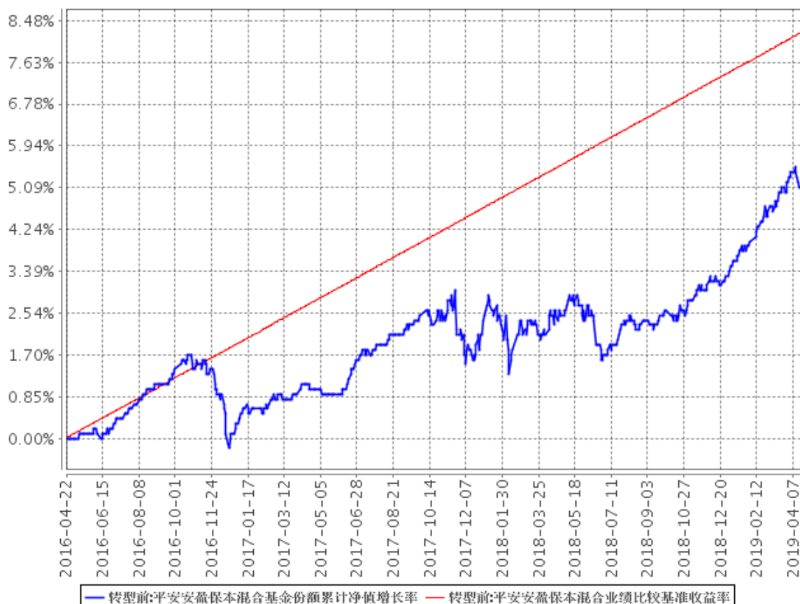
平安安盈保本混合基金份额累计净值增长率与同期业绩比较基准收益率的历史走势对比图