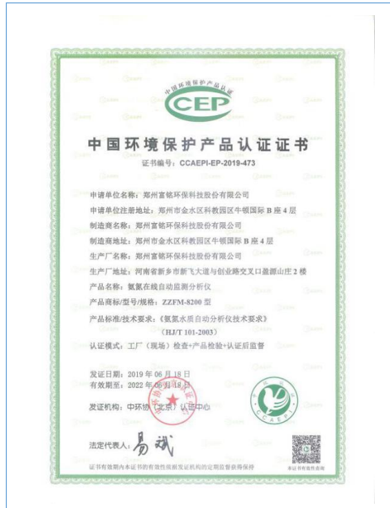
2019年6月取得中国环境保护产品认证书 (CCEP-氨氮在线自动监测分析仪)