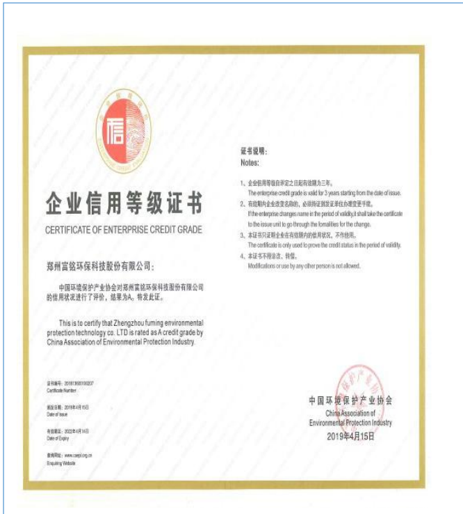
2019年4月取得企业信用等级证书