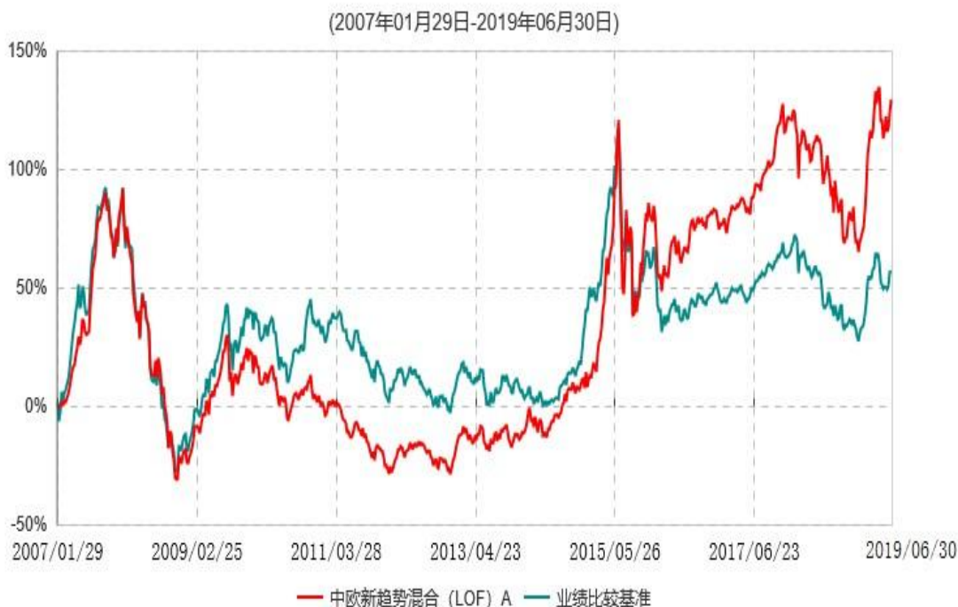
中欧新趋势混合（LOF）E 累计净值增长率与业绩比较基准收益率历史走势对比图