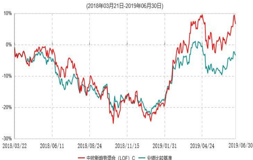
中欧新趋势混合（LOF）C累计净值增长率与业绩比较基准收益率历史走势对比图

注：本基金于2018年3月21日新增C类份额，图示日期为2018年3月22日至2019年06月30日。