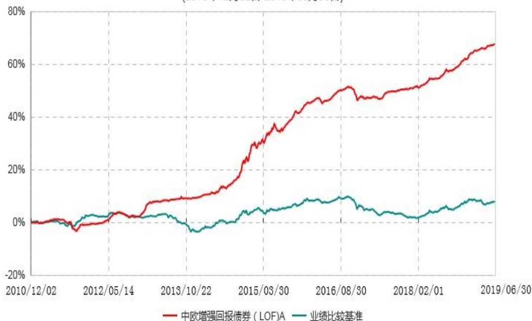
中欧增强回报债券（LOF）E累计净值增长率与业绩比较基准收益率历史走势对比图