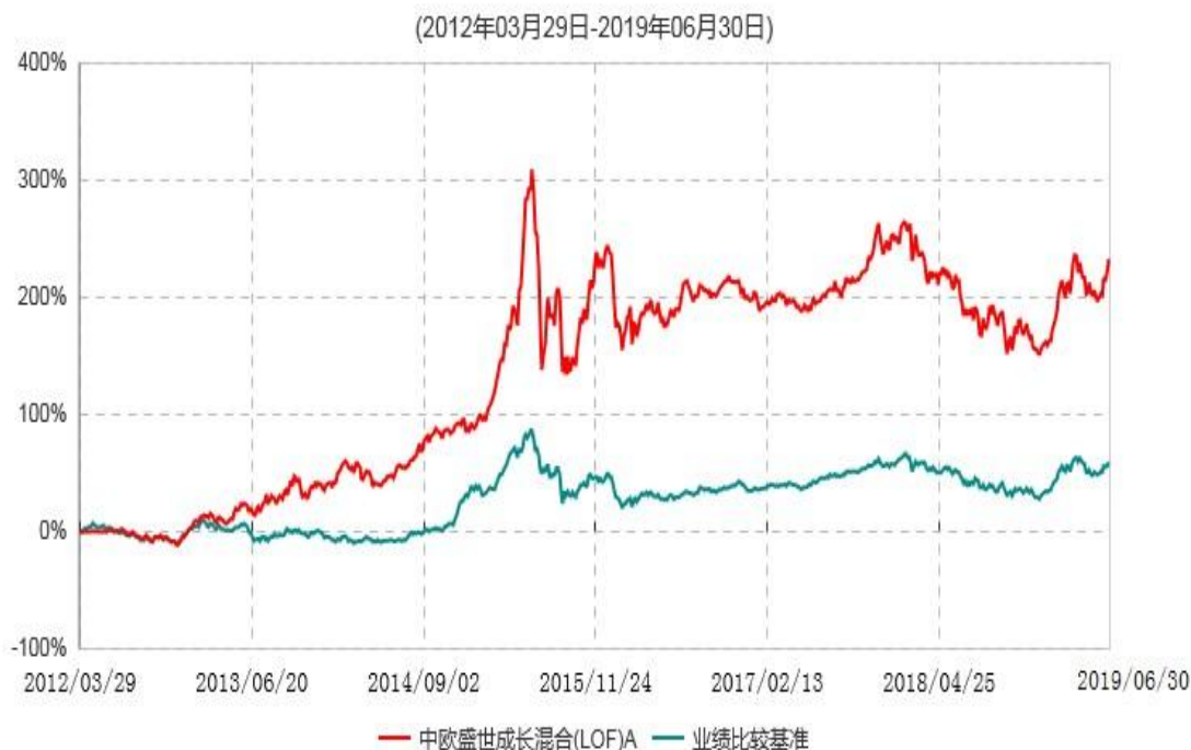
中欧盛世成长混合(LOF)A累计净值增长率与业绩比较基准收益率历史走势对比图