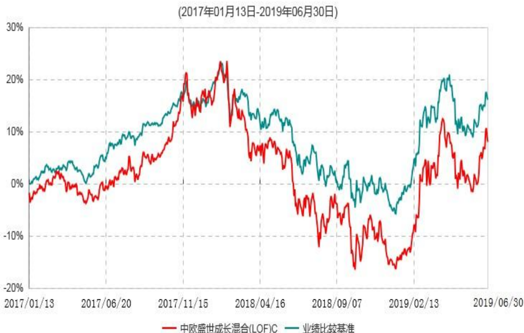
中欧盛世成长混合(LOF)C累计净值增长率与业绩比较基准收益率历史走势对比图

注：本基金于2017年1月12日新增C类份额，图示日期为2017年1月13日至2019年06月30日。