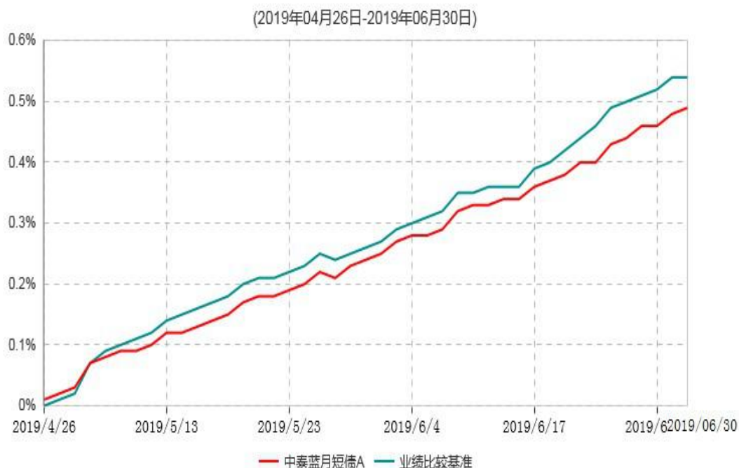
中泰蓝月短债A累计净值增长率与业绩比较基准收益率历史走势对比图