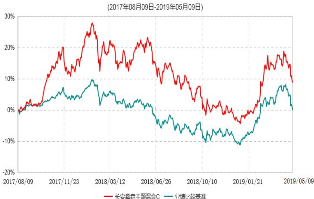
长安鑫垚主题混合C累计净值增长率与业绩比较基准收益率历史走势对比图

根据原“长安鑫垚主题轮动混合型证券投资基金”基金合同的规定,自基金合同生效之日起6个月内基金各项资产配置比例需符合基金合同要求。建仓期结束后,各项资产配置比例已符合基金合同有关投资比例的约定。自2019年5月10日,原“长安鑫垚主题轮动混合型证券投资基金”转型为“长安泓沅中短债债券型证券投资基金”。图示日期为2017年8月9日至2019年5月9日。