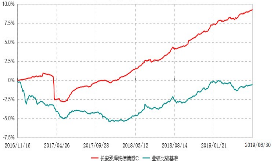
长安泓泽纯债债券C累计净值增长率与业绩比较基准收益率历史走势对比图 (2016年11月16日-2019年06月30日)

本基金基金合同生效日为 2016 年 11 月 16 日，按基金合同规定，本基金自基金合同生效起 6 个月为建仓期，截止到建仓期结束时，本基金的各项投资组合比例已符合基金合同的相关规定。基金合同生效日至报告期期末，本基金运作时间已满一年，图示日期为 2016 年 11 月 16 日至 2019 年 6 月 30 日。