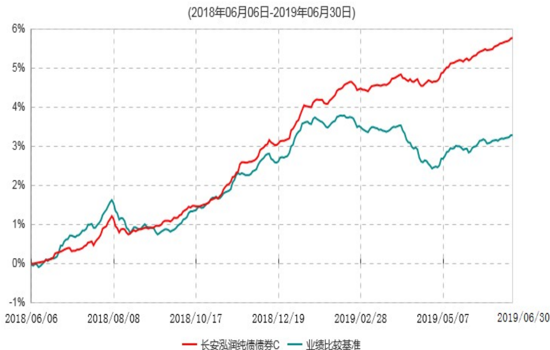
长安泓润纯债债券C累计净值增长率与业绩比较基准收益率历史走势对比图

根据基金合同的规定，自基金合同生效日起 6 个月内基金各项资产配置比例需符合基金合同要求。本基金在建仓期结束后，各项资产配置比例已符合基金合同有关投资比例的约定。基金合同生效日至报告期末，本基金运作时间已满一年。图示日期为 2018 年 06 月 06 日至 2019 年 06 月 30 日。