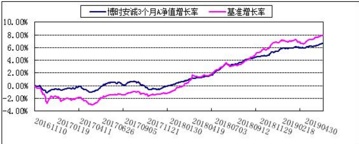
博时安诚 3 个月定开债 C