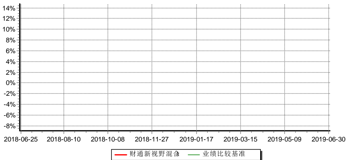
财通新视野灵活配置混合型证券投资基金C 累计净值增长率与业绩比较基准收益率历史走势对比图 (2018年06月25日-2019年6月30日)