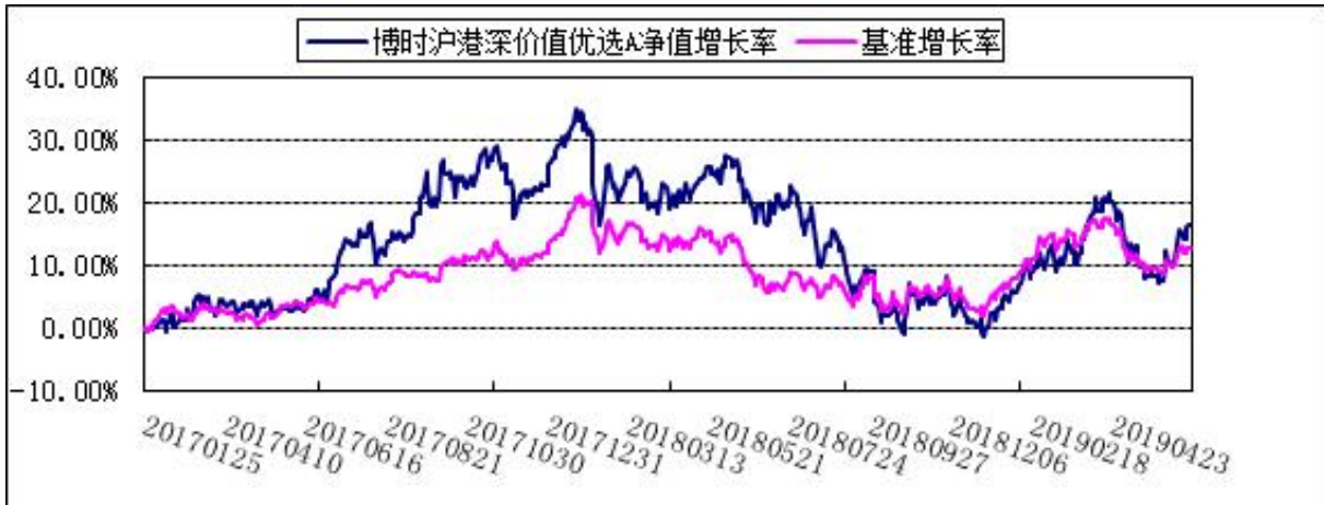
博时沪港深价值优选 C